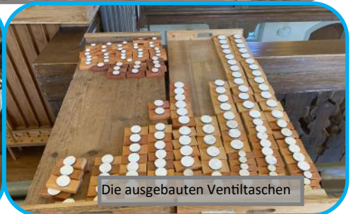
Die ausgebauten Ventiltaschen