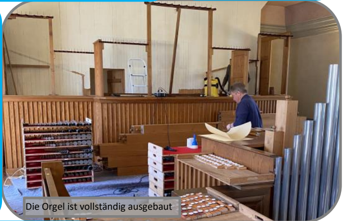
Die Orgel ist vollständig ausgebaut