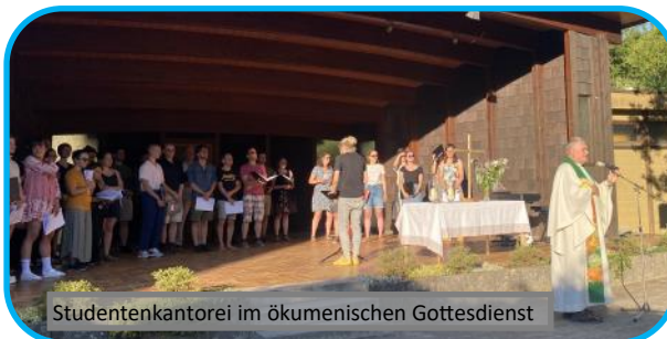
Studentenkantorei im ökumenischen Gottesdienst