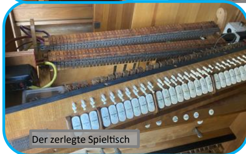
Der zerlegte Spieltisch