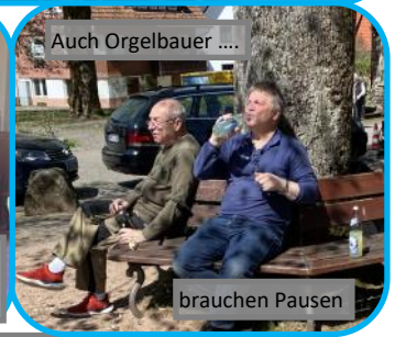
Auch Orgelbauer ...